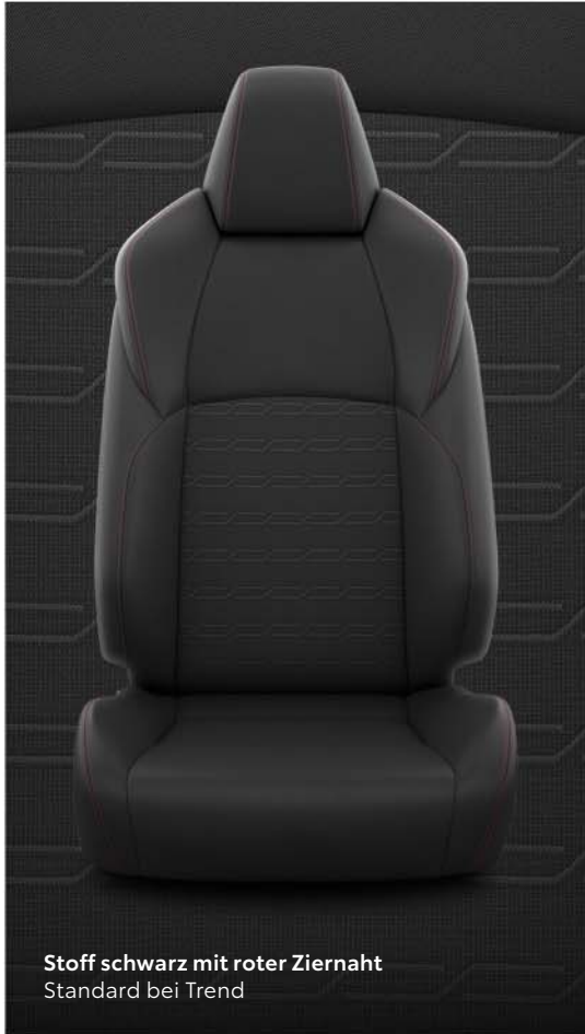
Stoff schwarz mit roter Ziernaht Standard bei Trend