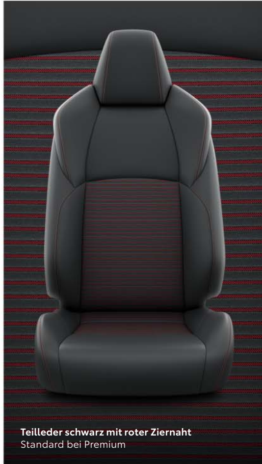
Teilleder schwarz mit roter Ziernaht Standard bei Premium