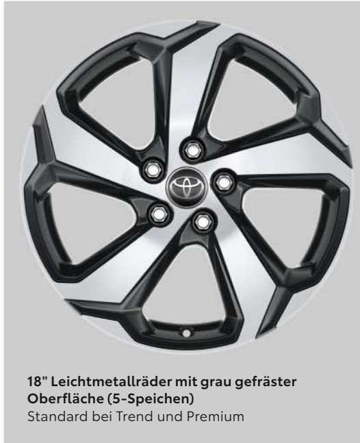
18" Leichtmetallräder mit grau gefräster Oberfläche (5-Speichen) Standard bei Trend und Premium

Komplettieren Sie den Look mit attraktiven 18"- oder 19"-Leichtmetallfelgen mit gefräster Oberfläche. Für den sportlichen Touch haben Sie schwarze Sitzbezüge in Echtleder mit Kontrastnähten.