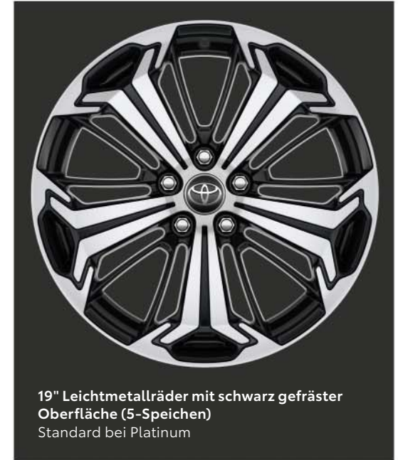
19" Leichtmetallräder mit schwarz gefräster Oberfläche (5-Speichen) Standard bei Platinum