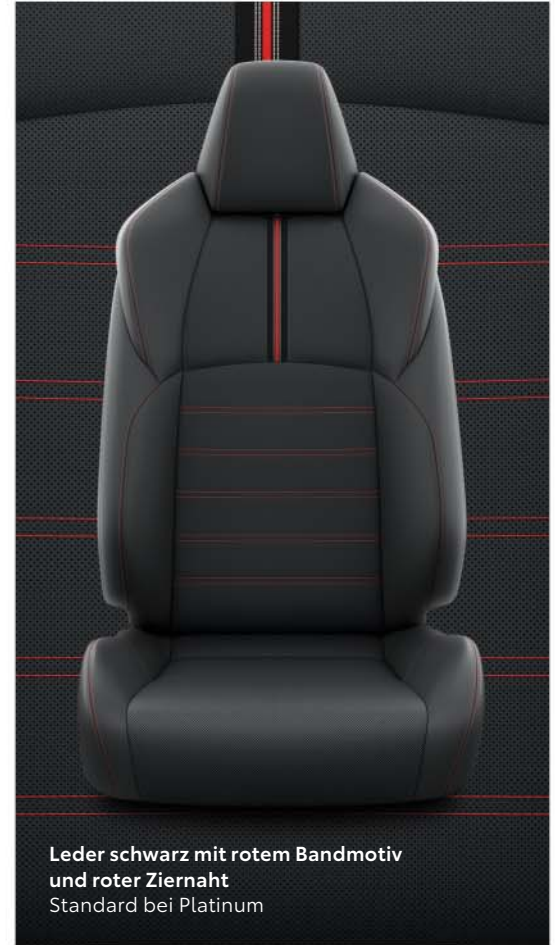
Leder schwarz mit rotem Bandmotiv und roter Ziernaht Standard bei Platinum