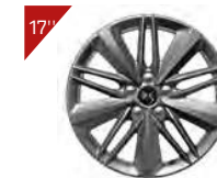
Alufelgen: ATHENES Code : ZHS7