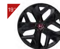
Alufelgen: MINNEAPOLIS Code : ZHT1