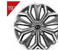
Alufelgen: FIRENZE Code : ZHT3