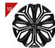
Alufelgen: SEVILLA Code : ZHT4