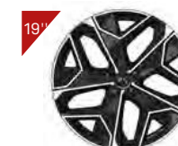
Alufelgen: LIMA Code : ZHT2