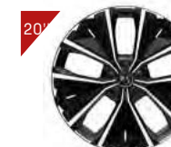
Alufelgen: SYDNEY Code : ZHT8