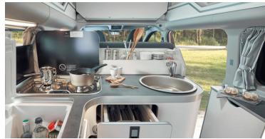
Ford Transit Custom Nugget