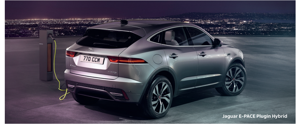
Jaguar E-PACE Plug-in Hybrid